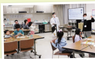
エネルギーの使い過ぎによる環境問題の話を聞く参加者

「環境教育ラボ スマイル☆アース」の方を講師に迎え、子ども対象のレインボースクール「エネルギーってなんだ? ペットボトル風車を作って」を開催。モノが動くにはエネルギーが必要であることをクイズ形式で楽しく学んだ後は、ペットボトルで風車を作り、最後は走りながら風車が回る様子を楽しみました。(藤野)