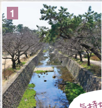
気持ちいい せせらぎ治いの 原川公園