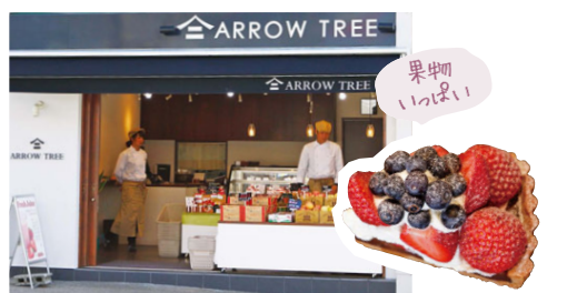
8 「ARROW TREE」は果物好きご用達の店。甘い誘惑にうっとり。